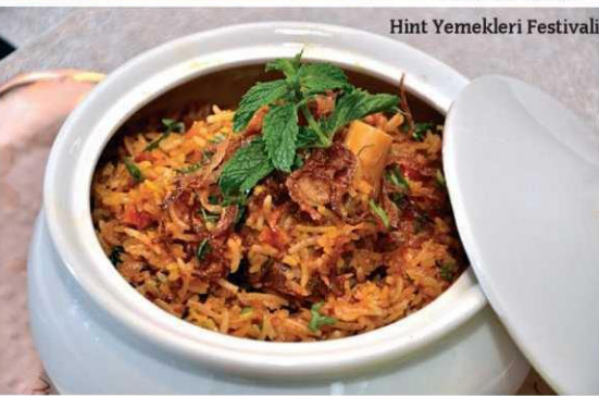
Hint Yemekleri Festivali