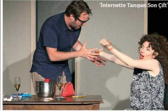
'İnternette Tanışan Son Çift'