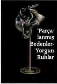
'Parçalanmış Bedenler-Yorgun Ruhlar'

Sergi Filiz Onat'ın 'Parçalanmış Bedenler-Yorgun Ruhlar' adını taşıyan heykel sergisini bugün 11.00-19.00 saatleri